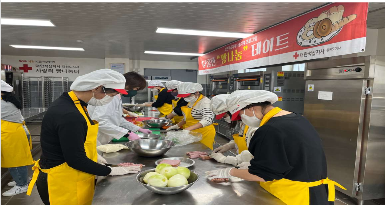
강원연구원이 23일(수) 실시한 ‘사랑의 빵나눔터’ 봉사활동에서 강원연구원 직원들이 빵을 만들고 있다.